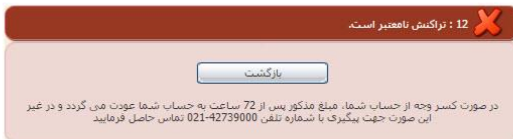
تصویر ۹- نمایش اخطار تراکنش ناموفق

با دریافت پیامک یا ایمیل جهت مراجعه به پورتال، برای مشاهده وضعیت خود اقدام نمایید. از طریق پورتال سازمان امور دانشجویان سربرگ کارتا بل را انتخاب نمایید. (تصویر ۱۰)