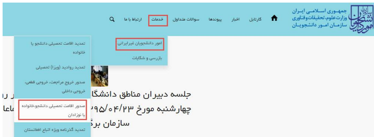
تصویر ۱-نمایش پورتال

از طریق پورتال سازمان امور دانشجویان و از سربرگ خدمات، بخش امور دانشجویان غیر ایرانی را انتخاب کرده و سپس در این قسمت جهت ثبت درخواست بر روی صدور اقامت تحصیلی دانشجویان، خانواده یا نوزادان کلیک نمایید. (تصویر ۱)