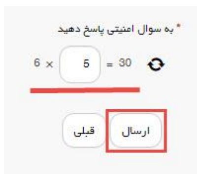
تصویر ۴-سوال امنیتی

سپس به سوال امنیتی پاسخ داده و بر روی دکمه ارسال کلیک کنید.(تصویر ۴)