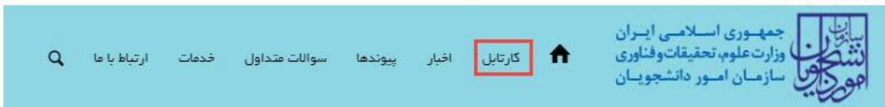
تصویر ۱۰- کارتابل شخصی

با دریافت پیامک یا ایمیل جهت مراجعه به پورتال، برای مشاهده وضعیت خود اقدام نمایید. از طریق پورتال سازمان امور دانشجویان سربرگ کارتا بل را انتخاب نمایید. (تصویر ۱۰)