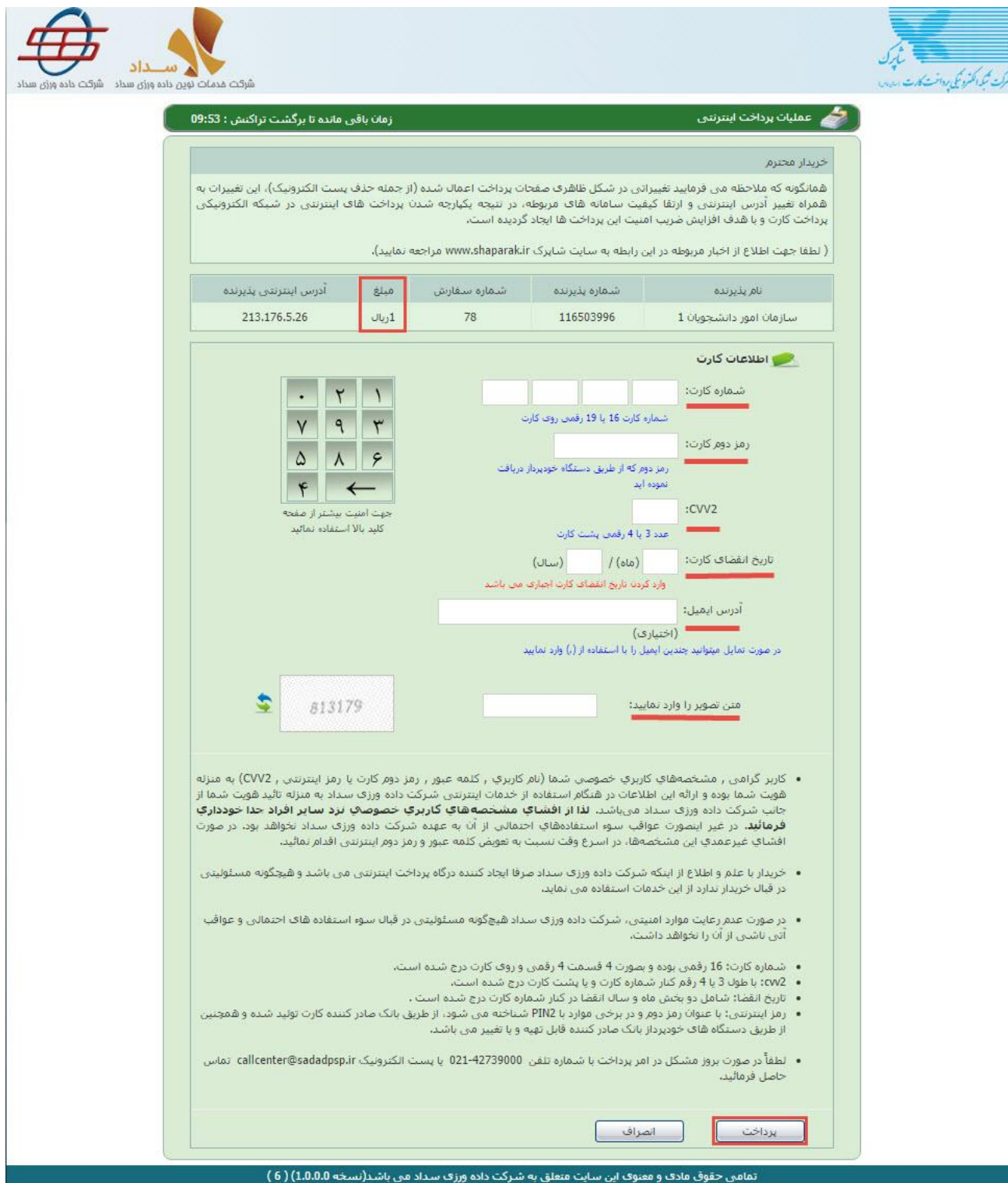
تصویر ۷-درگاه پرداخت الکترونیکی

پس از ارسال، درگاه بانکی جهت پرداخت مبلغ ذکر شده به شما نمایش داده می شود که می بایست اطلاعات کارت بانکی خود را وارد نمایید. (تصویر ۷)